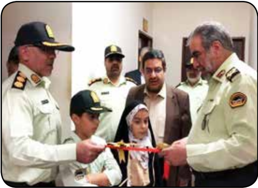
مختلف جامعه نیز اهتمام ویژه ای خواهد داشت.