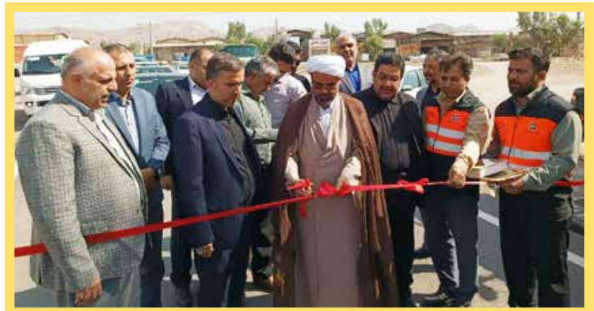
آیین بهره برداری از ۲۸ طرح عمرانی و اقتصادی و شروع عملیات اجرایی ۱۱ طرح مختلف با اعتباری بالغ بر ۱۳ هزار میلیارد ریال در شهرستان ری انجام شد.

همزمان با ایام هفته دولت ۱۴۰۳ باحضور قدرت اله شفیقی معاون توسعه منابع و نیروی انسانی استانداری تهران، مهدی باب الحوائجی معاون استاندار تهران و فرماندار ویژه شهرستان ری، معاونین فرماندار، ائمه جمعه، بخشداران، شهرداران، دهیاران، اعضای شوراهای اسلامی شهر و روستاهای تابعه، مدیران ادارات و دستگاه های استانی و شهرستانی و اصحاب رسانه از ۲۸ طرح عمرانی و اقتصادی در شهرستان ری به ارزش ۱۳ هزار میلیارد ریال بهره برداری شد.