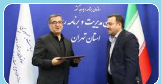
از سوی داود منظور معاون رئیس جمهور و رئیس سازمان

رئیس سازمان برنامه و بودجه کشور در حکم انتصاب سرپرست سازمان مدیریت و برنامه‌ریزی استان تهران، اهم مأموریت‌ها و وظایف این مسئولیت را ابلاغ کرد. در این حکم آمده است: امید است با اتکال به خداوند متعال و اهتمام به عدالت محوری، انقلابی‌گری، مردم‌داری، پاکدستی و فسادستیزی، قانون‌مداری و مفاد عهدنامه مدیران در دولت مردمی، با اتخاذ تدابیر مناسب در حل مشکلات