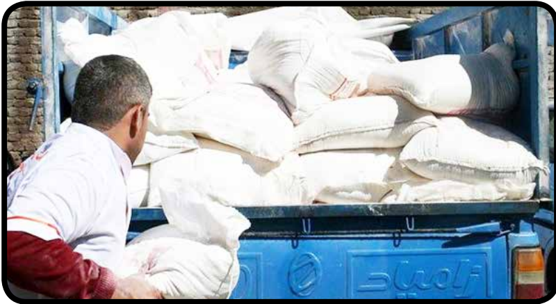
زیاد قیمت آن با آرد آزاد دانست و اظهار داشت: با وجود این تفاوت قیمت باید منتظر ظهور سلطان های صنعت آرد و نان باشیم.

با تلاش سربازان گمنام امام زمان (عج) در اداره کل اطلاعات جنوب تهران متخلفین صنعت آرد و نان شهرستان ری دستگیر شدند.