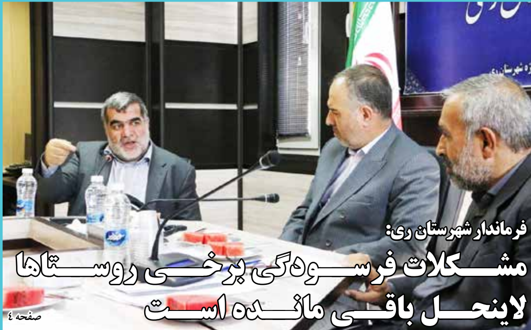
فرماندار شهرستان ری:

مشکلات فرسودگی برخی روستاها لاینحل باقی مانده است