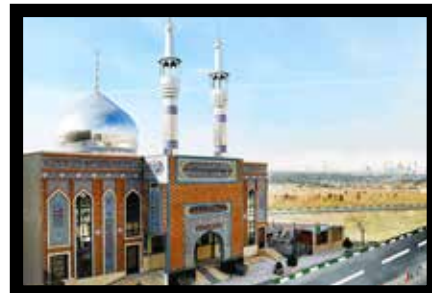
مسجد امیرالمومنین علی ابن ابیطالب (ع)