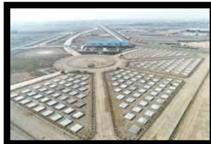
سایت اسکان اضطراری