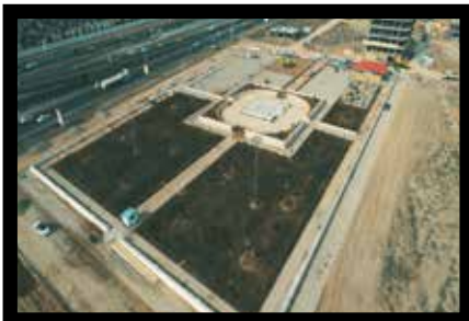
بوستان شهدای نفت بهران