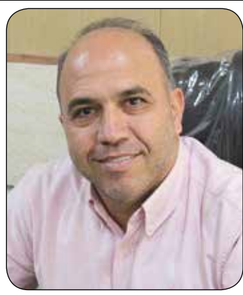
رئیس شورای اسلامی بخش کهریزک: روستاها سهم ویژه‌ای در رشد اقتصادی شهرستان دارند