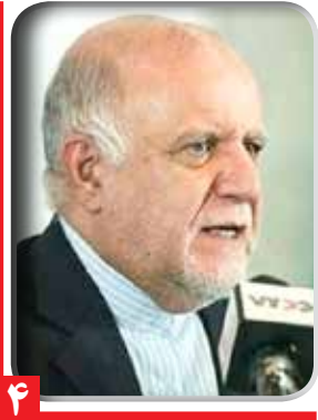
وزیر نفت: راه اندازی پارک علم و فناوری حوزه نفت در شهری