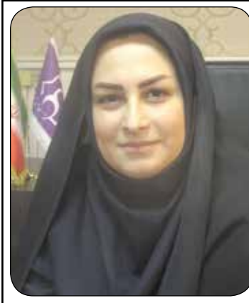
دهیار روستای امین آباد - حاجی آباد عنوان کرد اشتغالزایی و حمایت از نیروی کار بومی اولویت اول