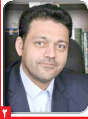
فرماندار ری: رسانه ها نقش مهمی در بالا بردن مشارکت سیاسی دارند