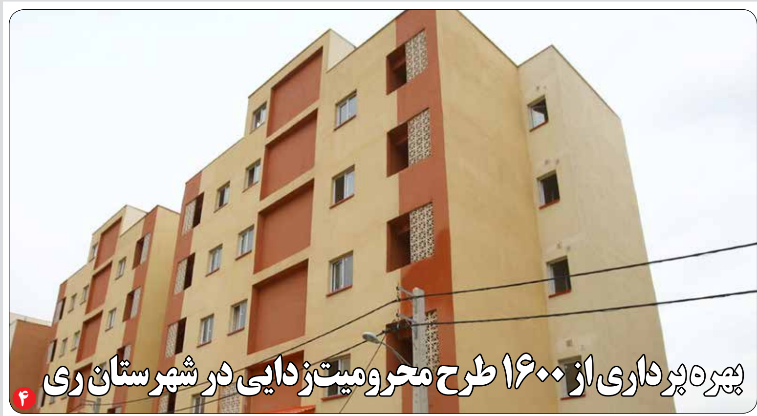
پنجره پرداری از ۱۶۰۰ طرح محرومیت زدایی در شهرستان ری