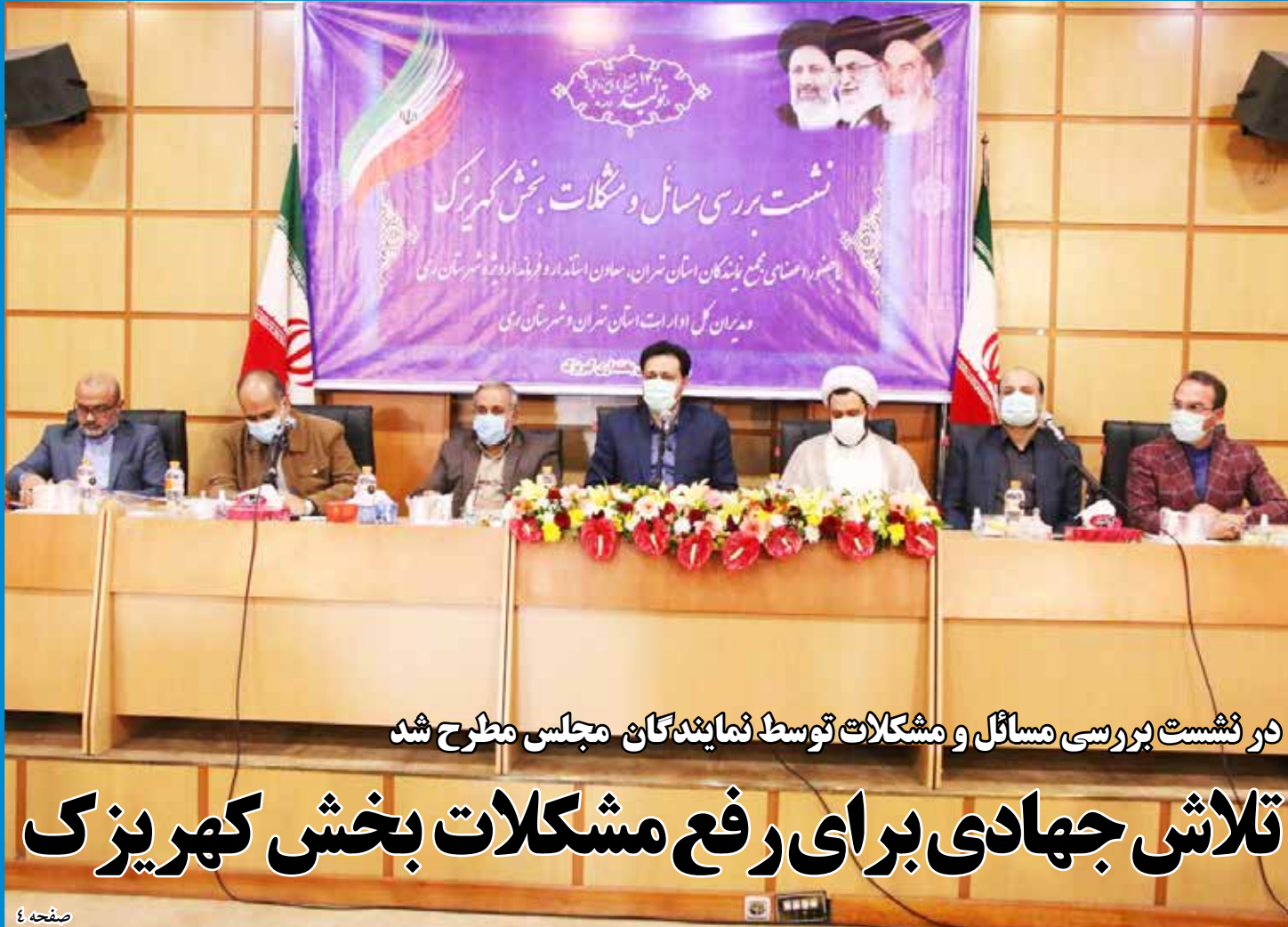
در نشست بررسی مسائل و مشکلات توسط نمایندگان مجلس مطرح شد