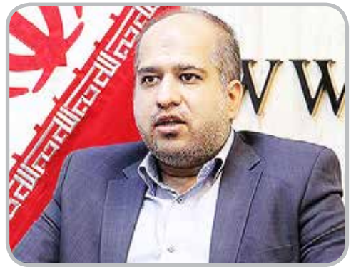
نماینده مردم تهران در مجلس با انتقاد از وضعیت اسفبار ساکنان مناطق نفر آباد و هاشم آباد، قول رسیدگی به مشکلات

آنها را داد. علی خزریان در جلسه علنی مجلس شورای اسلامی، در تذکری شفاهی گفت: آقای رئیس، در بازدیدی که هفته گذشته از محله های نفر آباد و هاشم آباد شهری داشت، قول دادم که صدای مردم مظلوم این مناطق باشم. مردمی که در خاک و خل های اطراف حرم حضرت عبدالعظیم (ع) در مقابل ظلم تکنوکرات ها ایستادند و تا امروز مقاومت کردند. نماینده مردم تهران، ری، شمیرانات، اسلامشهر و پردیس در مجلس شورای اسلامی ادامه داد: خانم ها و آقایان نماینده مجلس؛ زمانی که شهردار تکنوکرات تهران با حمایت مرحوم آقای هاشمی رفسنجانی در دهه ۷۰ بیان می کرد؛ تهران